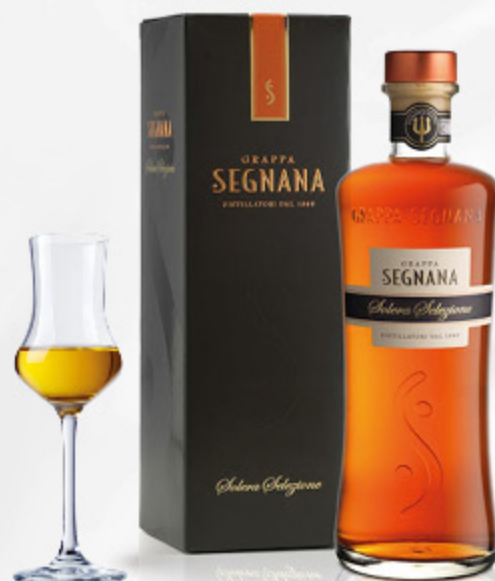
GRAPPA SEGNANA SOLERA SELEZIONE 70CL

“Grappa I.G. bianca ottenuta da selezionate vinacce di uve bianche e rosse del Friuli. Tipica, elegante, profumo di crosta di pane e liquirizia.”