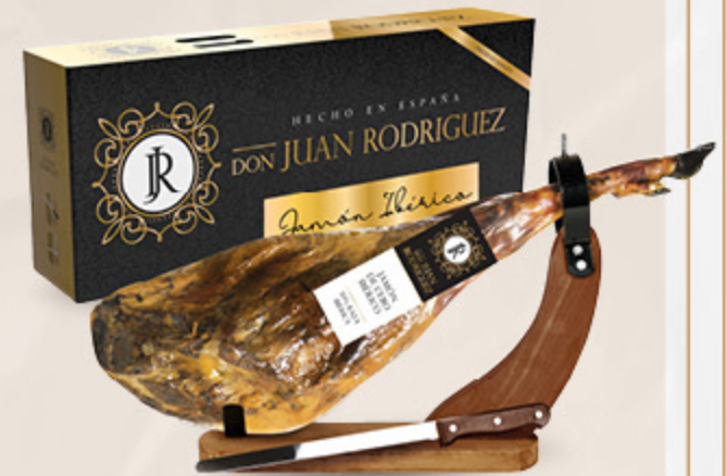
JAMON DE CEBO PATANEGRA CONFEZIONE REGALO 7.5KG