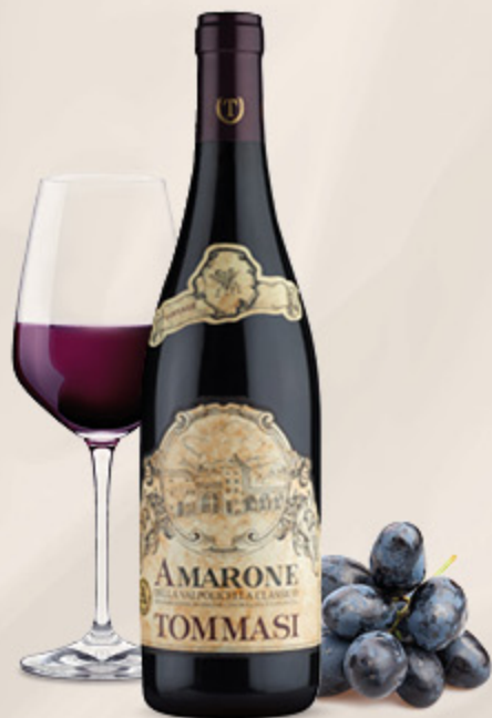
VINO AMARONE DOCG TOMMASI CLASSICO 75CL

«È prodotto ancora oggi in forma artigianale seguendo un'antica tradizione che prevede l'appassimento delle migliori uve per qualche mese, a cui segue una maturazione in botti di rovere. È un vino intenso che presenta un ricco aroma di ciliegia matura e di piccoli frutti rossi, con una nota finale di cioccolato. Si presenta ampio ed equilibrato»