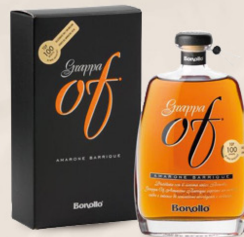
GRAPPA OF AMARONE BARRIQUE BONOLLO 35CL