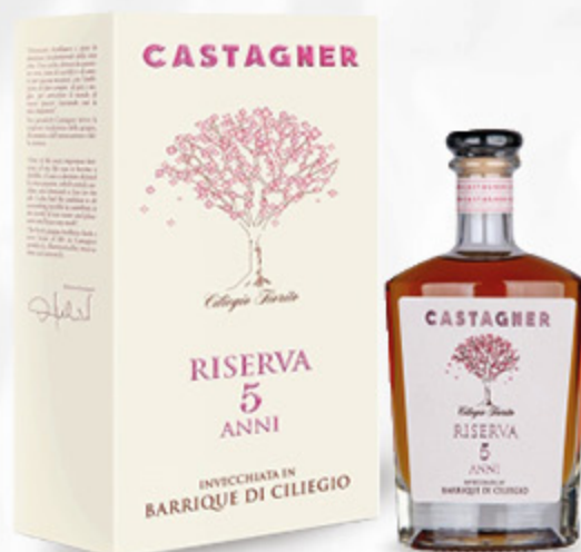
GRAPPA CASTAGNER RISERVA 5 ANNI 35CL