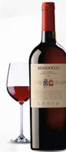
VINO MAGLIOCCO CALABRIA IGT LENTO 75CL