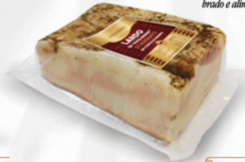
LARDO "PATA NEGRA" STAGIONATO CONCA

“ Lardo di qualità, ricavato da suini iberici allevati allo stato brado e alimentati con ghiande ”