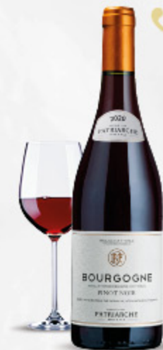
VINO PINOT NOIR BOURGOGNE PATRIARCHE 75CL

«Vino rosso prodotto nella zona di Borgogna, propone al degustatore un inconsueto spessore organolettico. Ideale per accompagnare secondi sostanziosi di carne grazie al suo temperamento caratteristico e energetico.» € 39.87 al €/Lt 29,90