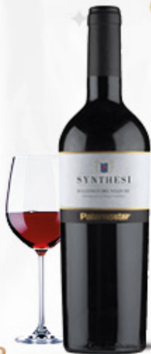
VINO AGLIANICO DEL VULTURE DOC SYNTHESI PATERNOSTER 75CL

«Sintetizza il territorio, la struttura e la longevità del vino Aglianico del Vulture. Colore rosso rubino, offre un fragrante bouquet fruttat. Al palato è asciutto e vellutato, di grande armonia e persistenza gustativa.»