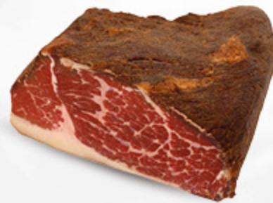
BLACK ANGUS AFFUMICATO