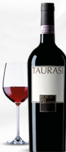
VINO TAURASI DOCG FEUDI DI SAN GREGORIO 75CL