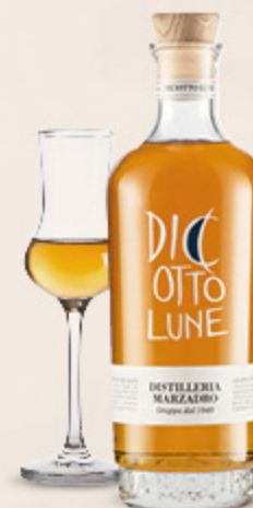
GRAPPA MARZADRO 18 LUNE 50CL

“Grappa Stravecchia ottenuta dalla distillazione a Bagnomaria sia di vinacce rosse che di vinacce bianche. Il tempo di invecchiamento ricalca i ritmi della natura: di luna in luna scorrono 18 mesi. Dal profumo intenso e amabile e dalla struttura morbida e asciutta.”