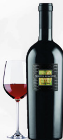
VINO PRIMITIVO DI MANDURIA DOP FEUDI SAN MARZANO 75CL