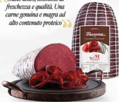
BRESAOLA DI FASSONA ITALIANA

“ Gusto unico, sinonimo di freschezza e qualità. Una carne genuina e magra ad alto contenuto proteico ”