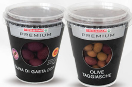
OLIVE DI GAETA DOP/TAGGIASCHE PREMIUM - 200G