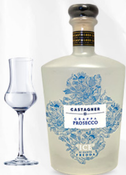
GRAPPA PROSECCO ICE CASTAGNER 50CL