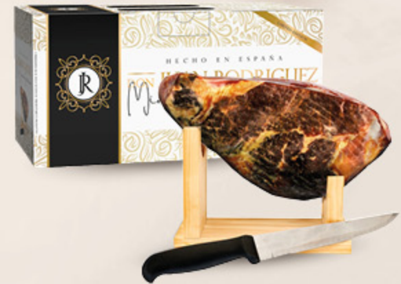
MINI JAMON SERRANO CONFEZIONE REGALO 1KG