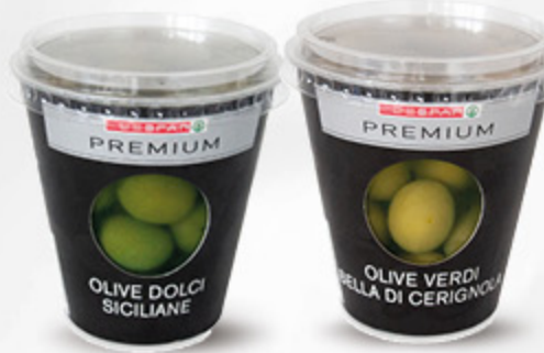
OLIVE DOLCI SICILIANE/LECCINO/ BELLA DI CERIGNOLA PREMIUM - 180/200G