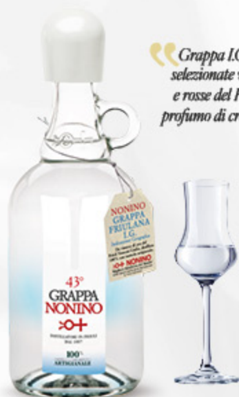
GRAPPA FRIULANA NONINO 70CL