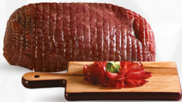
SPECK DI CINGHIALE RENZINI

“ Ottenuto dalla parte più tenera e pregiata della coscia ovvero la fesa, lo Speck di Cinghiale è privato di tutte le parti di grasso eccedenti e dopo la salatura a secco, viene stagionato in modo naturale. ”