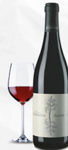
VINO BAROLO DOCG LO ZOCCOLAIO 75CL